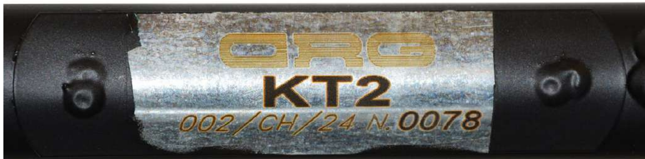
Photo du marquage du numéro d'homologation / Photo of the homologation number marking

Le marquage indiqué sur le tube transversal arrière doit rester clairement visible en permanence. / The marking located on the rear strut must be clearly visible at all times.