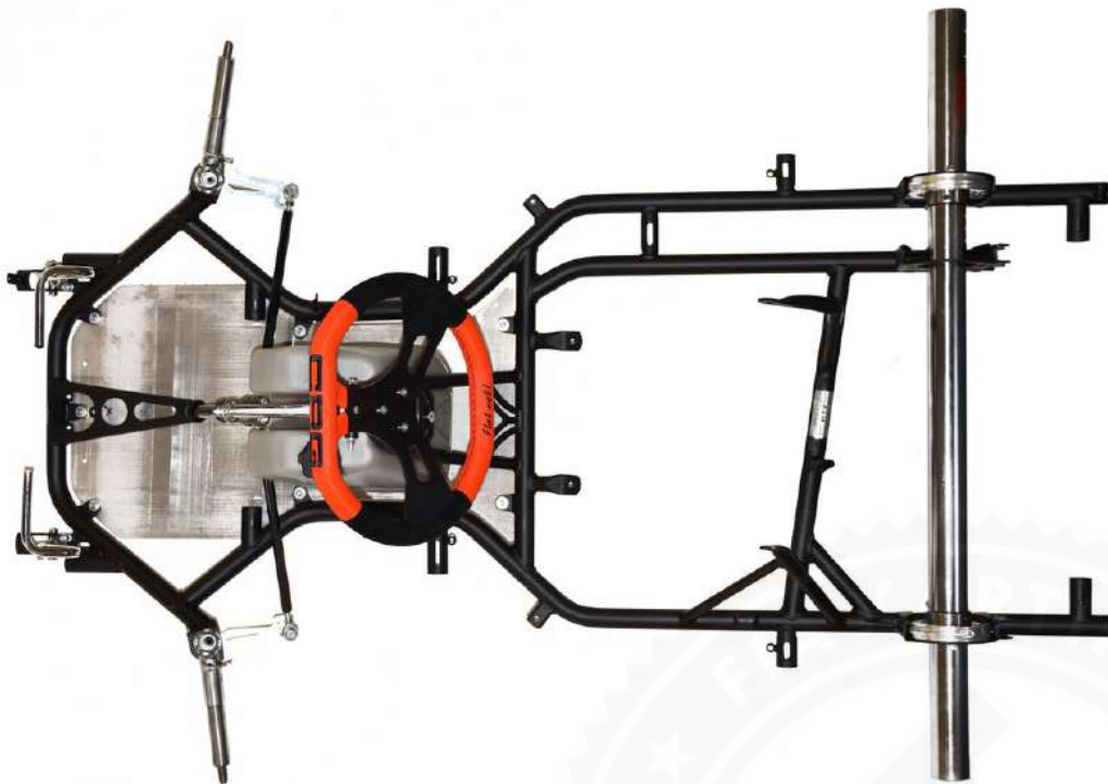
Photo du dessus du châssis complet identique à l'un des modèles présentés à l'homologation sans pare-chocs, freins, carrosserie, siège ni pneumatiques / Photo from above of complete chassis identical to one of the models submitted for homologation without bumpers, brakes, bodywork, seat or tyres.

Signature et tampon de l'ASN / Signature and stamp of the ASN