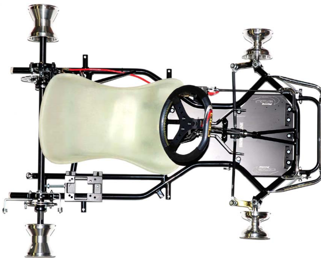
FOTO DEL TELAIO COMPLETO IDENTICO AD UNO DEI MODELLI PRESENTATI ALL'ISPEZIONE, SENZA CARROZZERIE E SENZA PNEUMATICI